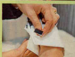
Flora zeigt: Manschetten-Knöpfe sind ein festlicher Schmuck für Anzug-Hemden