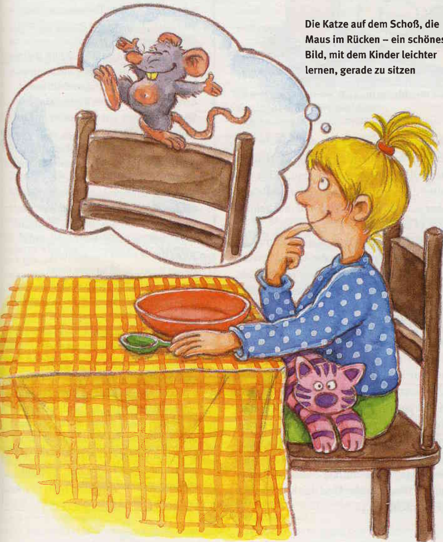
Die Katze auf dem Schoß, die Maus im Rücken – ein schönes Bild, mit dem Kinder leichter lernen, gerade zu sitzen

Wer den Tisch deckt, ihn abräumt, wer Geschirr wäscht, muss in einer Familienkonferenz verabredet werden“, erklärt Struck. Und Essen braucht Rituale. „Das Essen sollte mit einem Gebet beginnen, oder alle fassen sich an der Hand und sagen ‚Guten Appetit‘.“ Auch Witze erzählen und Singen sind erlaubt, findet der ☺